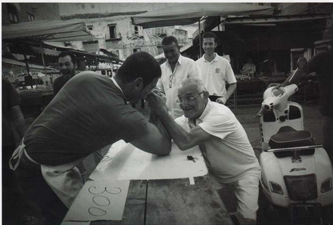
Il braccio di ferro che racconto nel testo.

Questo mese nasce una nuova rubrica, Quartiere, dedicata alla Street Photography, e in particolare alla fotografia di Quartiere.