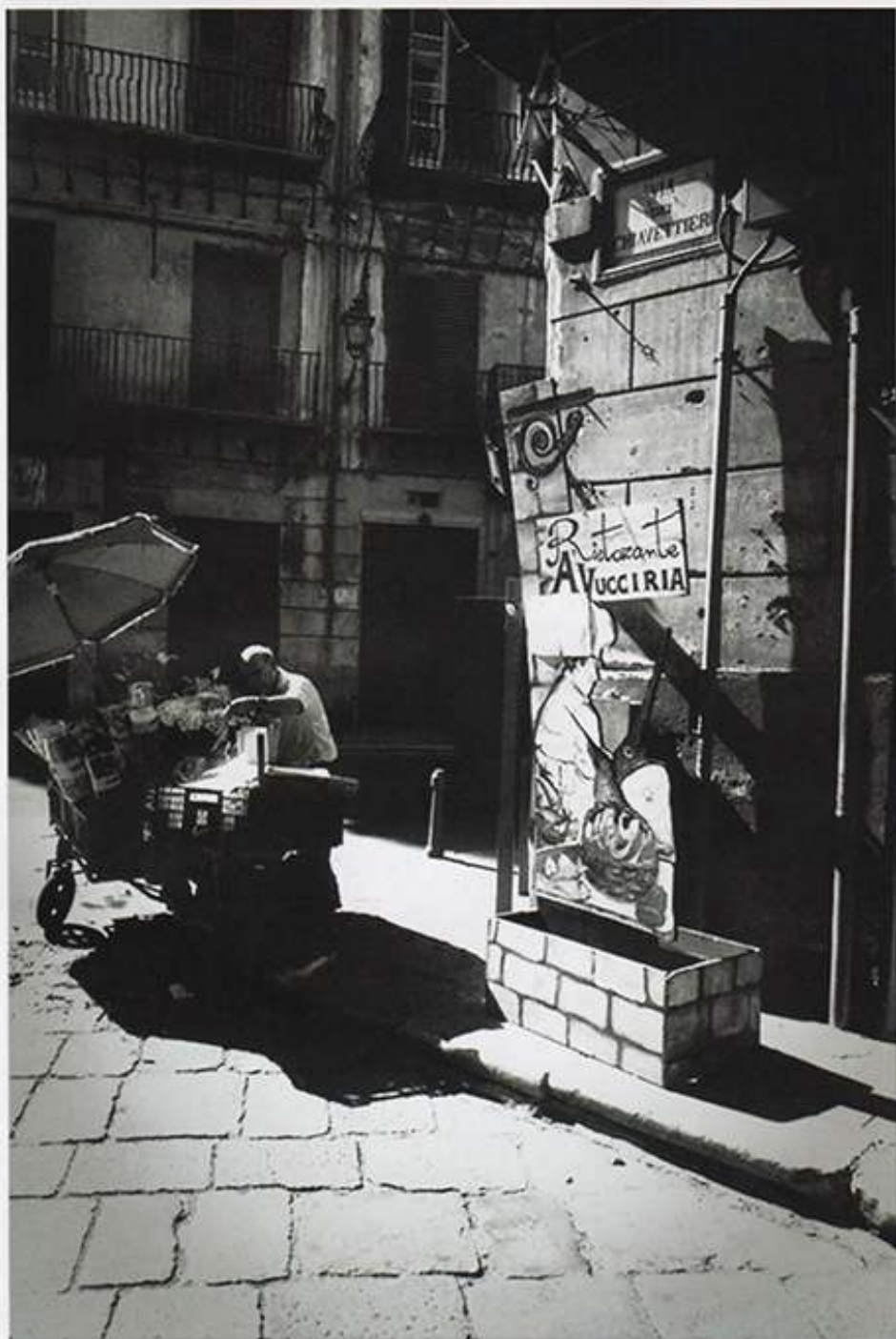
Il ristorante Vucciria in via Chiavettieri

Dalle tue immagini emergono forme di volti e luoghi della tua terra: sono l'espressione del binomio persona-luogo.