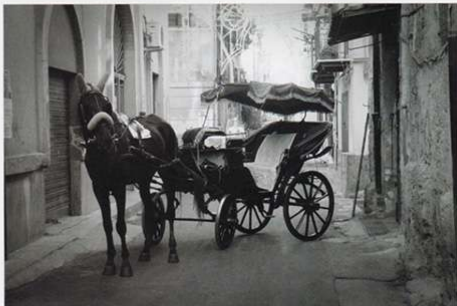
Una carrozzella si ripara dal sole.