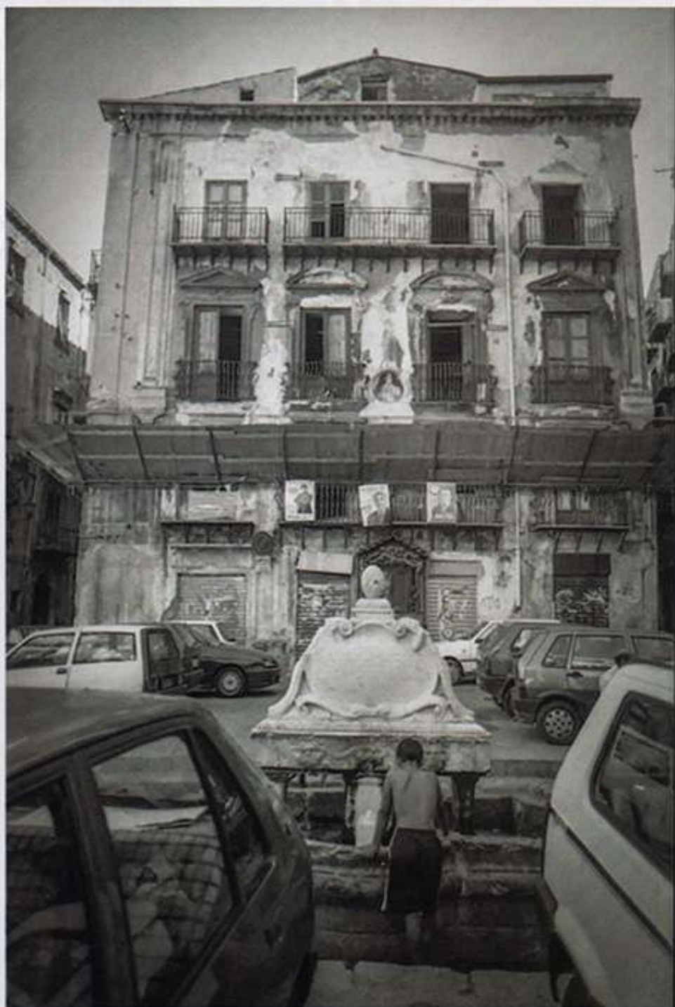
Palermo è una città barocca; nel mezzo una fontana.

Chi desidera proporre il proprio lavoro per la pubblicazione in Quartiere su Tutti Fotografi può contattare giuseppe.ferraina@fotografia.it